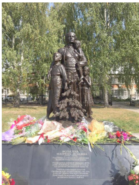
Памятник Операции "Дети" и М.И.Вольской в г.Городец, Нижегородской области. Установлен 1 сентября 2020 года на пл.Пролетарской