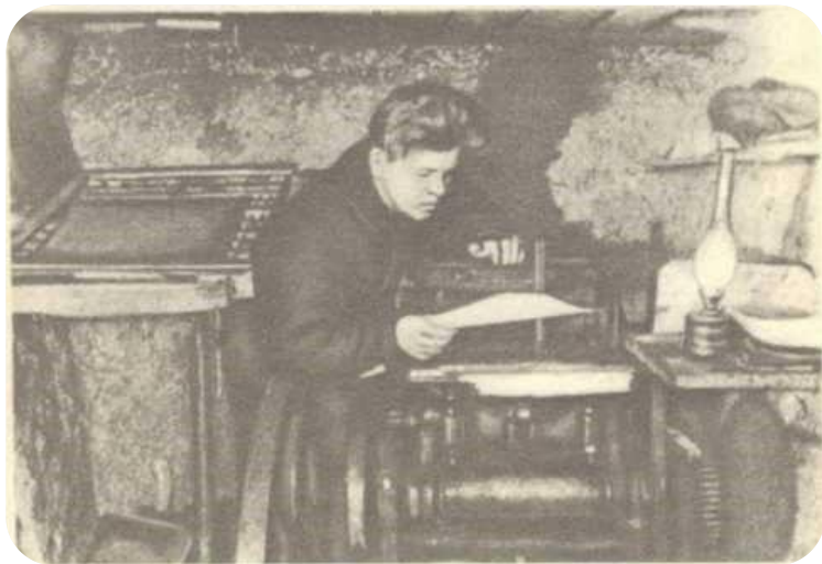
В подпольной типографии. Оставшевский район Смоленской области, 1941 год