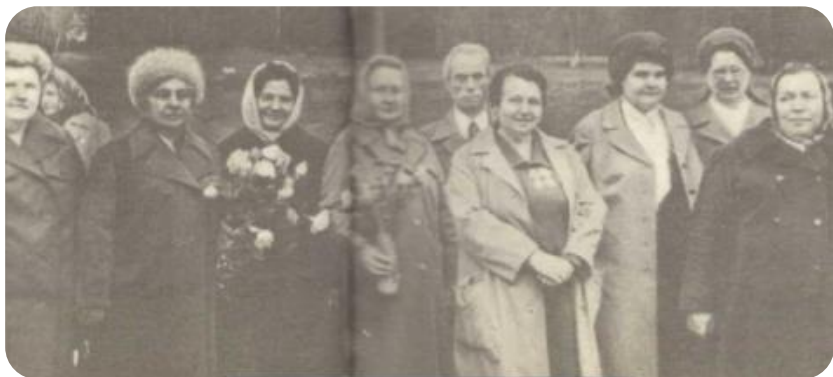
На встрече в Смольках