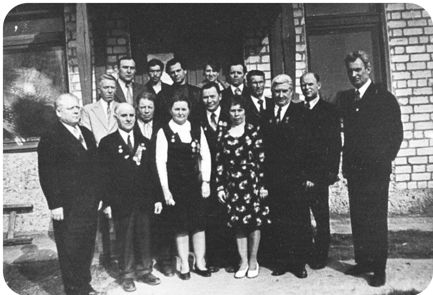
1976 год. Первая встреча бывших подростков и партизан.