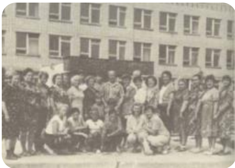
1988 год. В пос. Вербовском г. Муром встретились следопыты, партизаны и участники перехода 1942 года