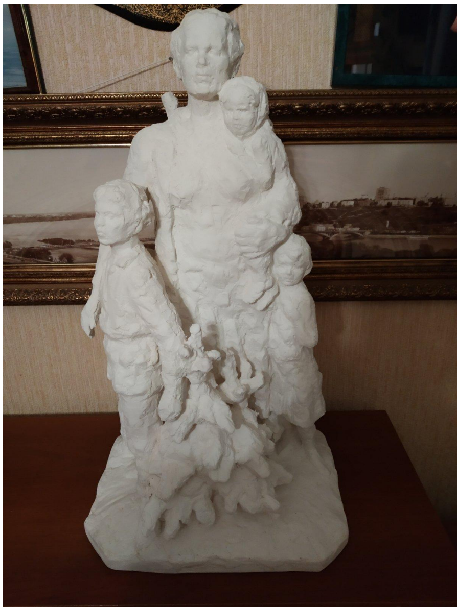
Макет памятника М.И.Вольской