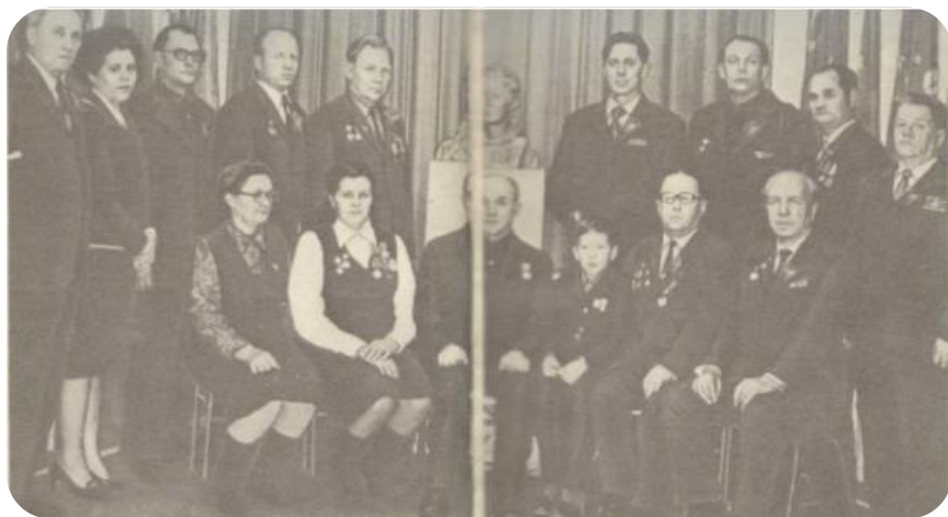
1972 год. Ногинск, школа №4. Ветераны Первой партизанской бригады у бюста Вали Богоявленской