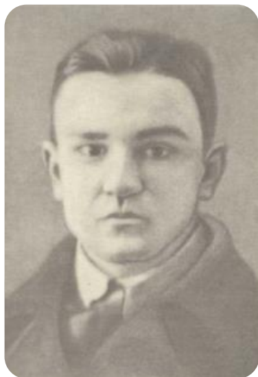
Петр Жеглов, 1943 год