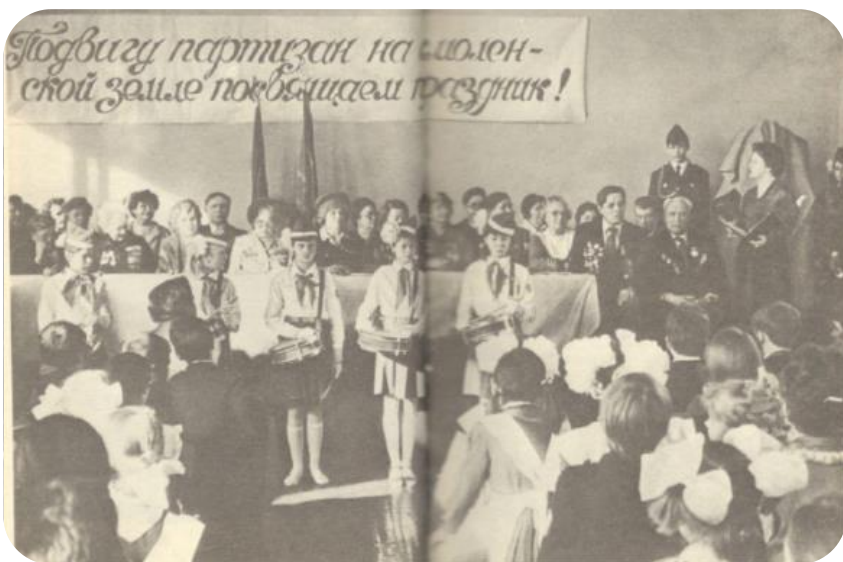
На празднике в школе № 40 г. Дзержинска