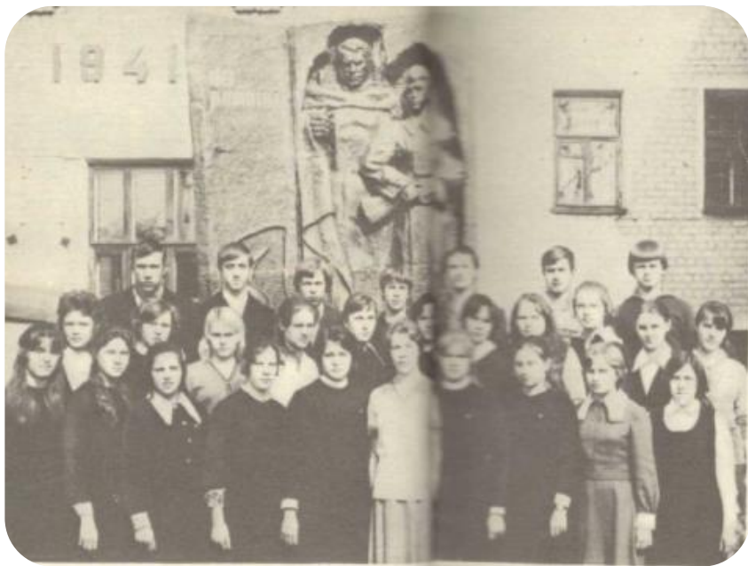
Следопыты школы № 4 г. Бор, 1977 год