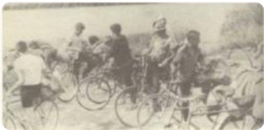
1987 год. Участники перехода по маршруту М. И. Вольской