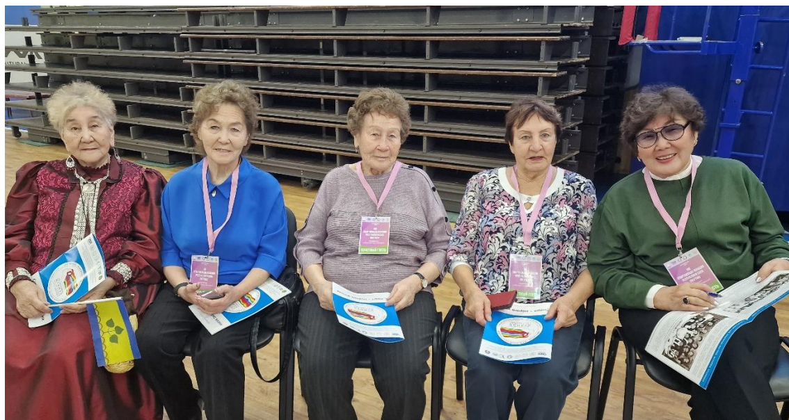
Рисунок 33 Ветераны Спартакиад женщин Якутии, 2024