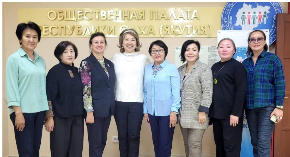
Рисунок 14. Обсуждение мероприятий VIII Спартакиады женщин РС(Я) в СЖО РС(Я), 2024 г.