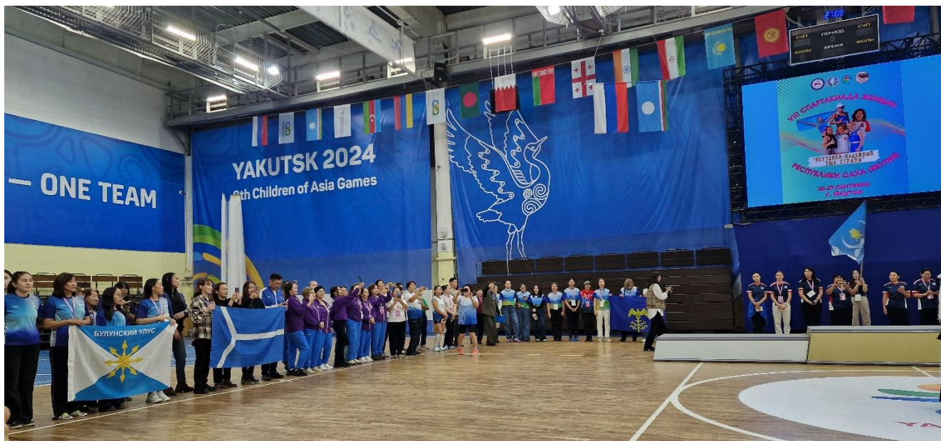
Рисунок 34. Команды в ожидании итогов VIII Спартакиады женщин Якутии, 2024 г.