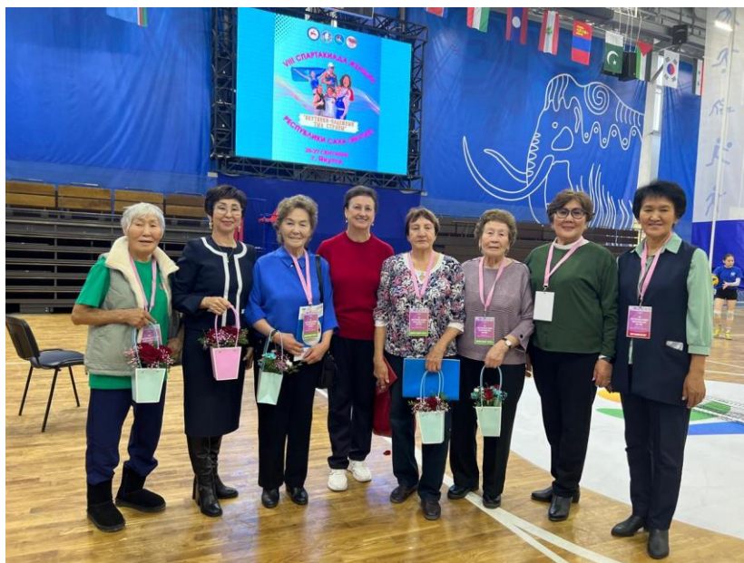
Рисунок 2. Ветераны спорта, 2024 г.

Участницы VIII Спартакиады женщин РС (Я) «Якутянки – надежный тыл», имели возможность посетить акцию «Оберегая сердца», 25 – 26 сентября 2024 г. в г. Якутске ул. Орджоникидзе 28а, СК «50 лет Победы».