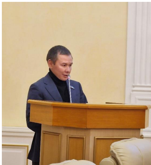
Рисунок 26. Председатель постоянного комитета Государственного Собрания (Ил Тумэн) РС(Я) по делам молодежи, физической культуре и спорту, Георгий Балакишин, 2024 г.