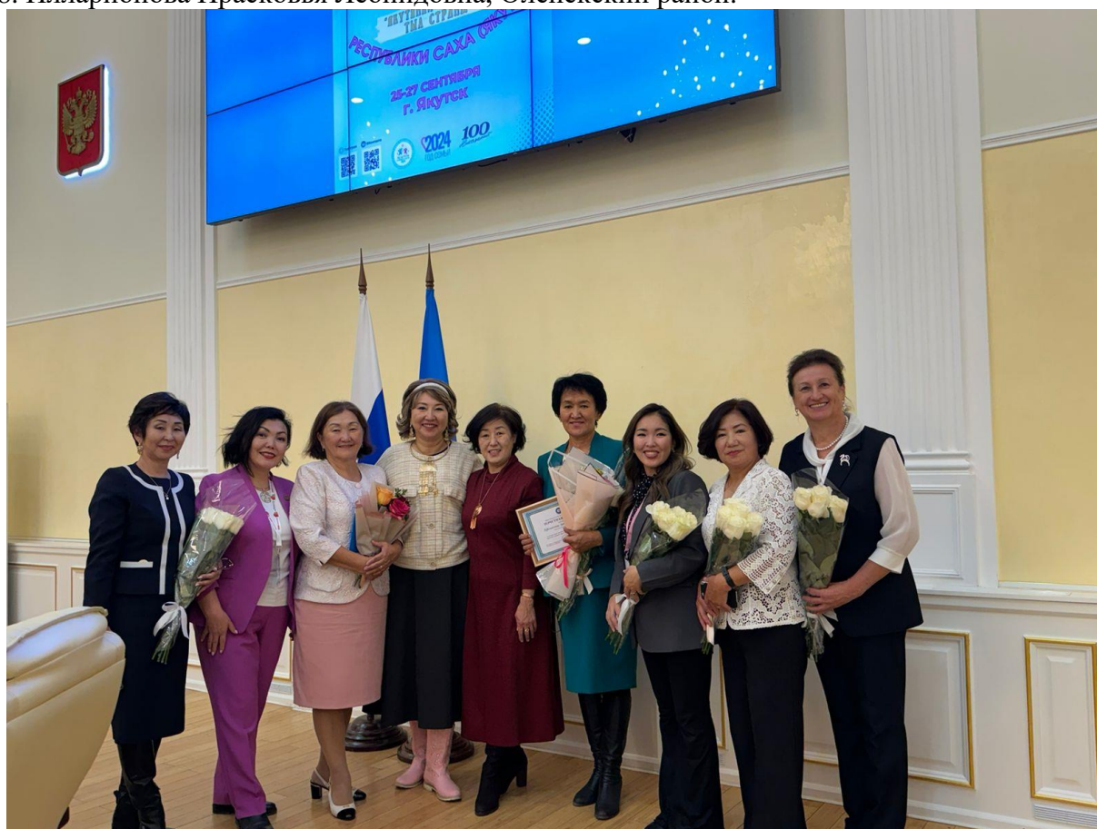
Рисунок 31. Участники Пленума СЖО РС(Я), 2024