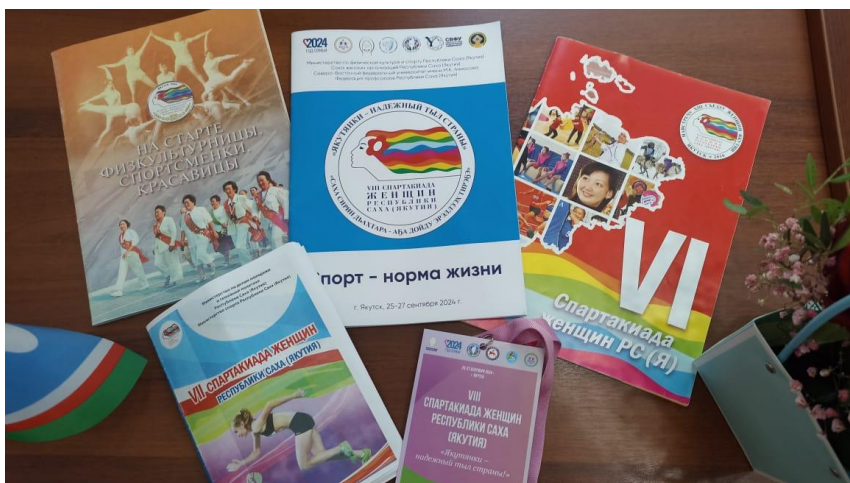
Рисунок 40. Книги, буклеты, изданные к Спартакиадам женщин Якутии

Пресс-служба УФКиМС @ufkims #якутия #уфкимс #спортякутии #спортнормажизни #спартакиадаженщинякутии #сжя #минспорт #женщиныякутии https://t.me/ufkims/6790