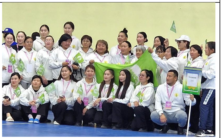
Рисунок 6. Женская команда Таттинского улуса, 2024 г.