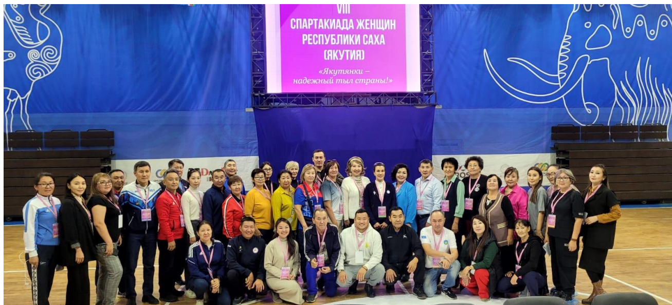
Рисунок 1. Подготовительные мероприятия к проведению VIII Спартакиады женщин РС(Я), 2024 г.

Мероприятия для женщин, как Спартакиада, направлены на развитие женского спорта, укрепляют физическое здоровье и поддерживают их участие в жизни общества.