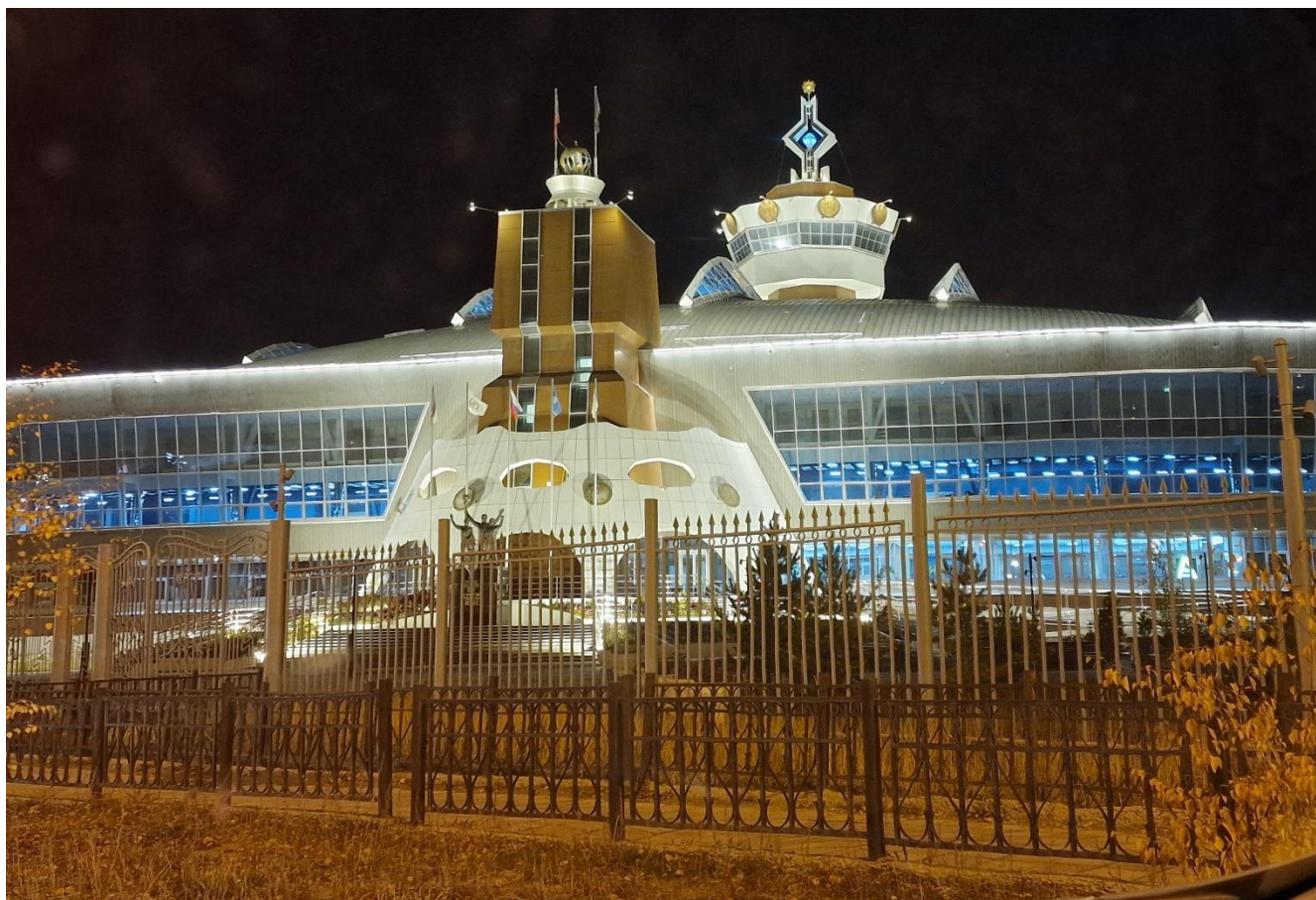
Рисунок 16. Спортивный комплекс ЦСП «Триумф», где проходили спортивные состязания по легкой атлетике и испытания комплекса ГТО участниц VIII Спартакиады женщин Республики Саха (Якутия) 25-27 сентября 2024 г.