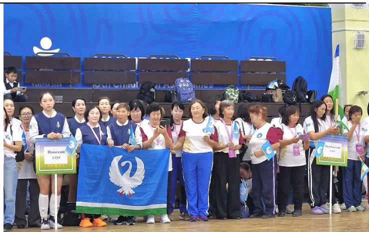
Рисунок 4. Команды Намского улуса и Нюрбинского района, 2024 г.