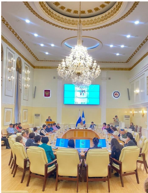
Рисунок 17. Пленум Союза женских организаций РС(Я), посвященный VIII Спартакиаде женщин Якутии, 2024 г.

26 сентября 2024 г. состоялось Торжественного заседания Пленума Союза женских организаций Республики Саха (Якутия)