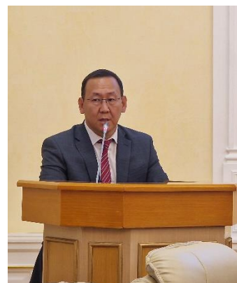
Рисунок 18. 1 Заместитель министра по физической культуре и спорту Гаврил Мохначевский, 2024 г.

На экранах – тематическая заставка, во время мероприятия проецируются презентационные видеослайды о VIII Спартакиаде женщин Республики