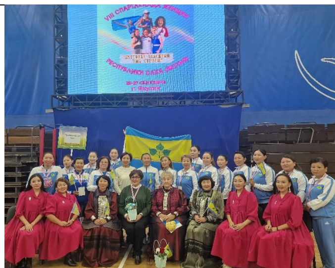
Рисунок 8. Команда Чурапчинского улуса, 2024 г.