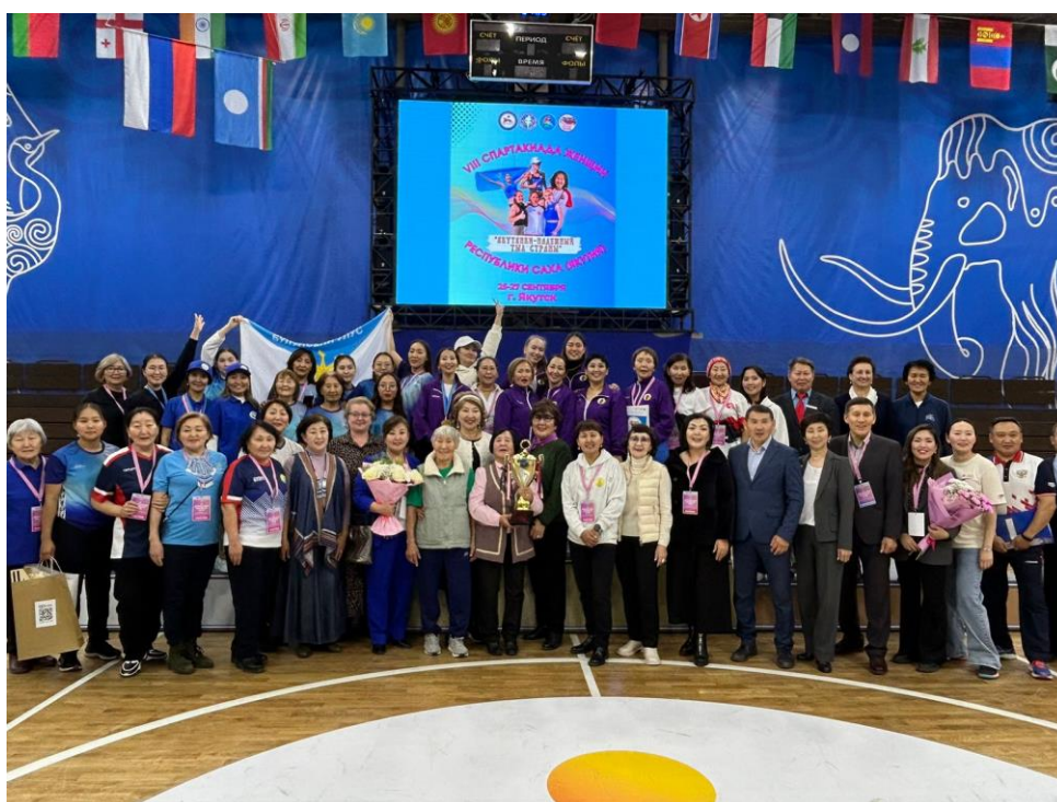
Рисунок 38. Фото на память после подведения итогов VIII Спартакиады женщин РС(Я), 25-27.09.2024 г