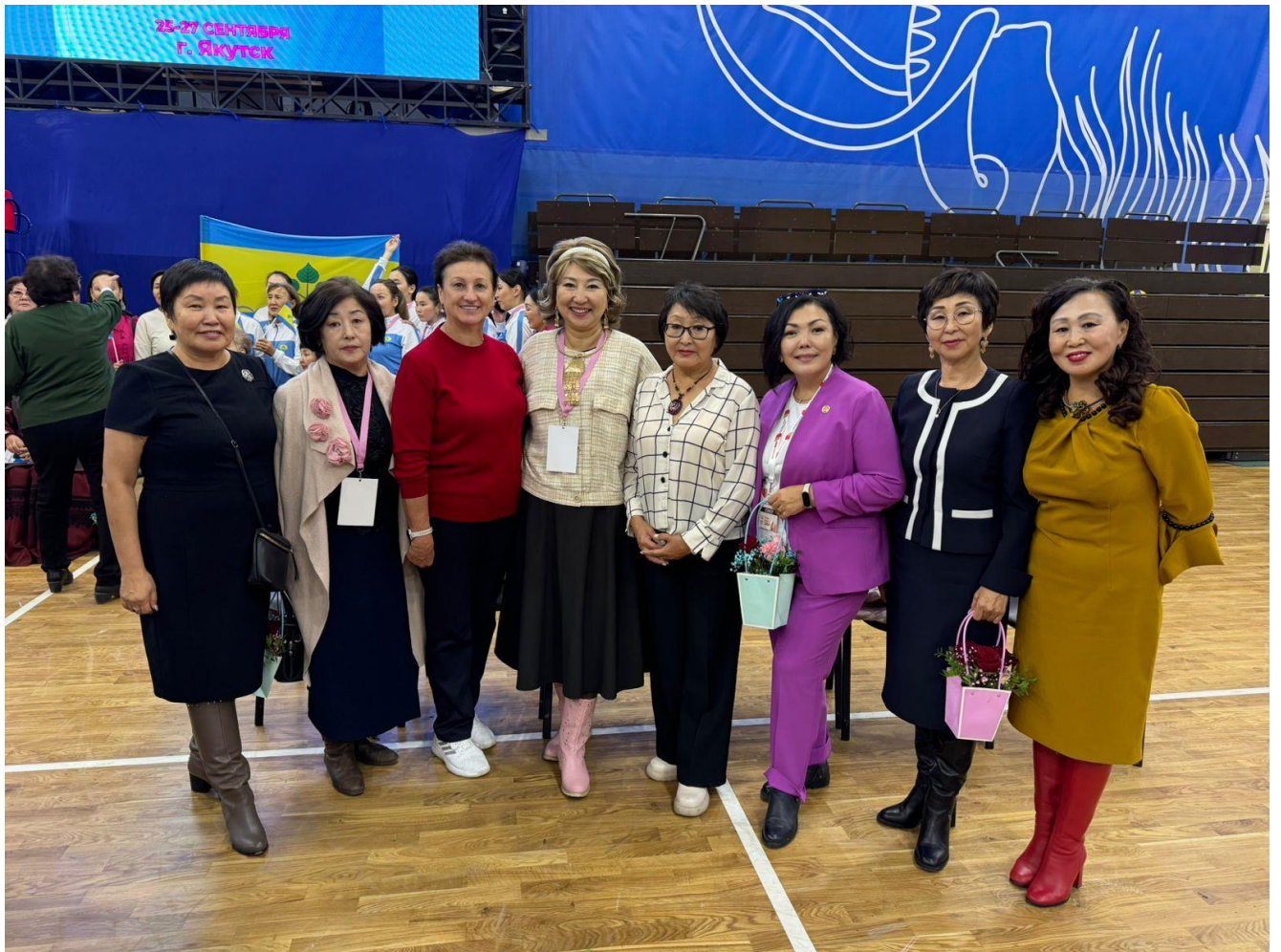
Рисунок 13. Союз женских организаций РС(Я) является главным организатором женского спортивного праздника – VIII Спартакиада женщин РС(Я) 25-27 сентября 2024 г.