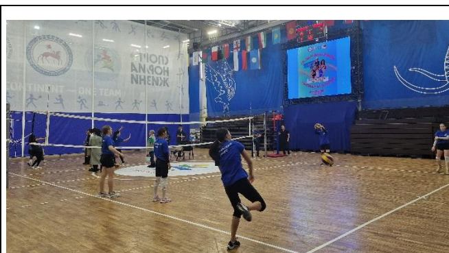
Рисунок 10. Начало состязаний по волейболу. VIII Спартакиада женщин РС(Я), 2024