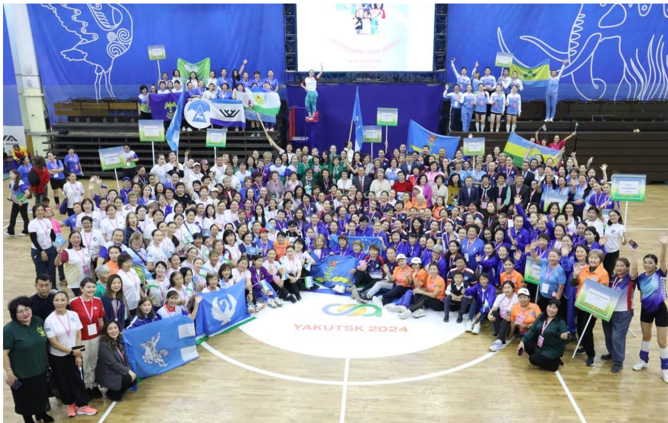
Рисунок 15. Спортивные команды районов Республики Саха (Якутия) на VIII Спартакиаде женщин Якутии, 25-27.09.2024 г.