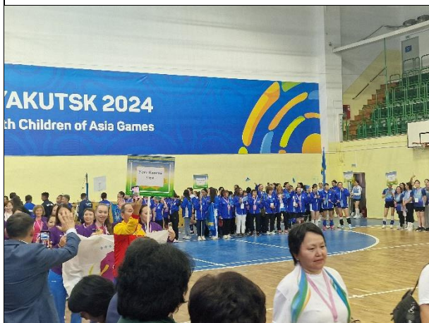
Рисунок 5. Женские спортивные команды районов РС(Я), 2024 г.