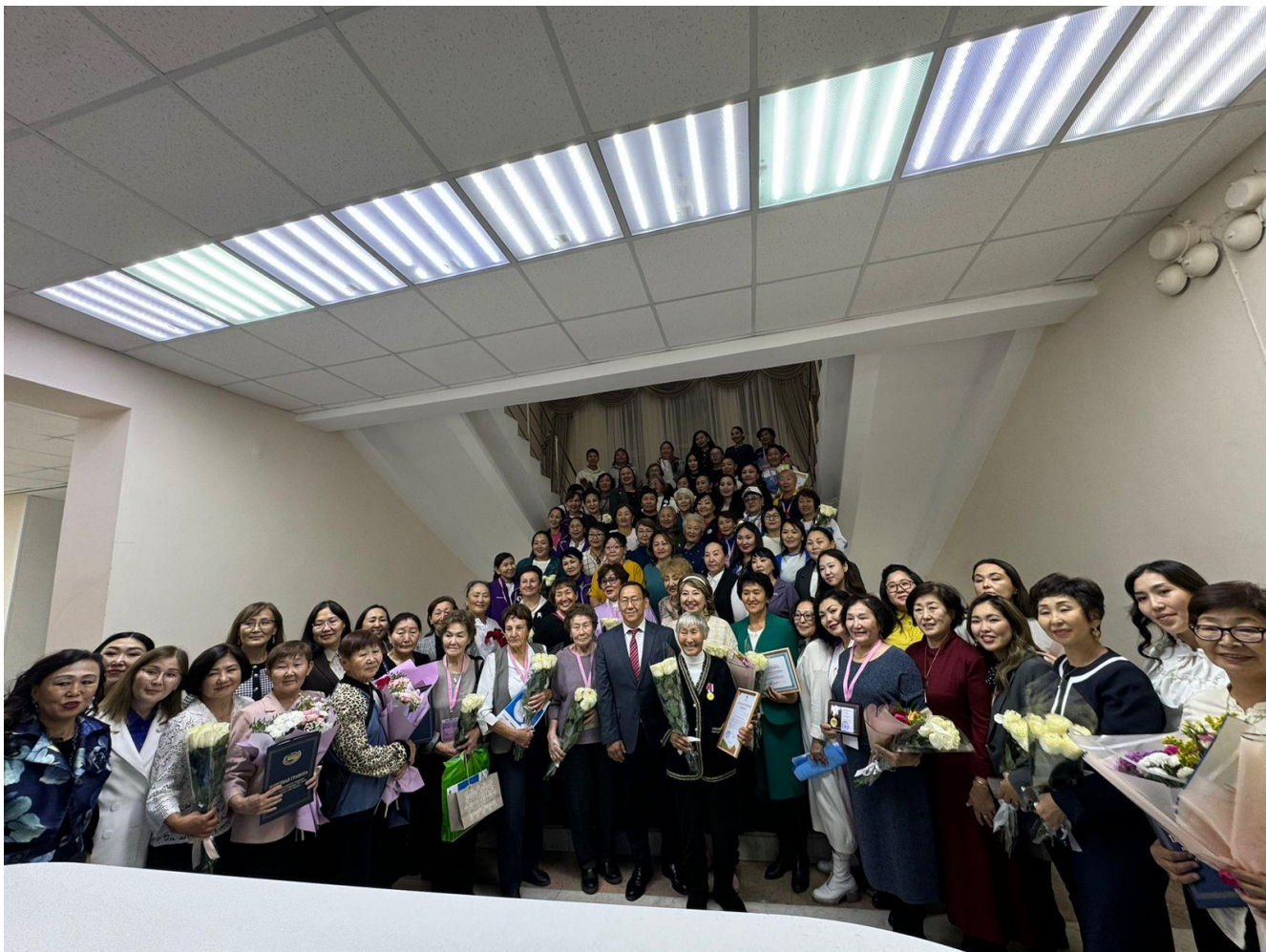
Рисунок 35. Пленум СЖО РС(Я), 2024 г.