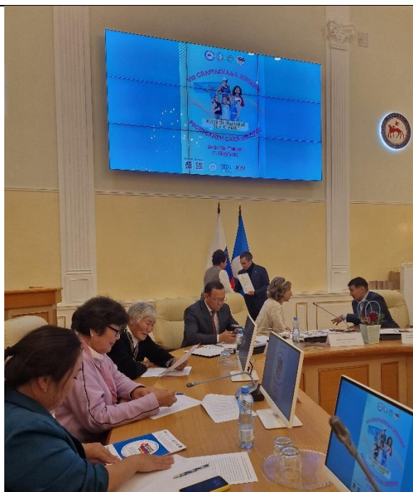
Рисунок 28. Пленум СЖО РС(Я), 2024 г.