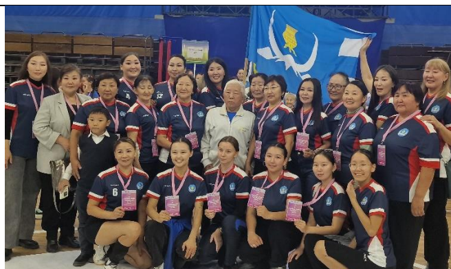
Рисунок 9. Женская команда Верхоянского улуса. VIII Спартакиада женщин РС(Я), 2024