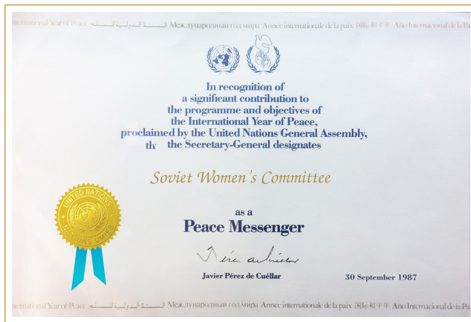
Дипломом ООН «Посланник мира» (Peace Messenger)

Сегодня Союз женщин России продолжает его международную деятельность и обладает консультативным статусом при Экономическом и социальном совете ООН (ЭКОСОС).