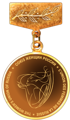
Памятная медаль Союза женщин России