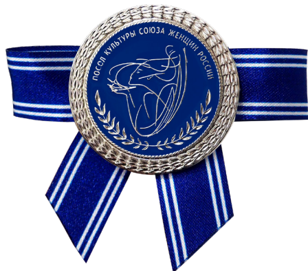
Почетное звание «Посол культуры Союза женщин России»

Почетное звание «Посол культуры Союза женщин России» является общественной наградой, учрежденной Общероссийской общественно-государственной организацией «Союз женщин России» в соответствии со статьей 24 Федерального закона от 19.05.1995 № 82-ФЗ «Об общественных объединениях».