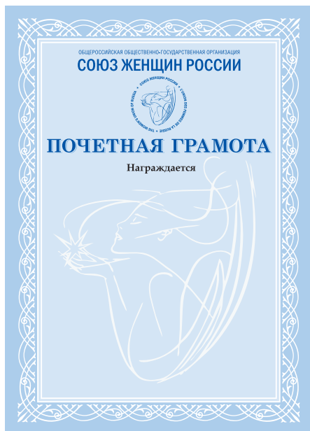
Почётная грамота Союза женщин России