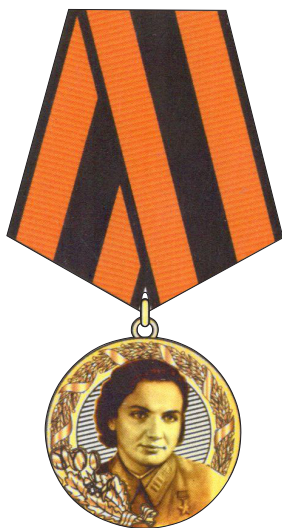
Памятная медаль В.С.Гризодубовой