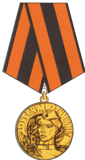
Памятная медаль «Дочерям Отчизны»