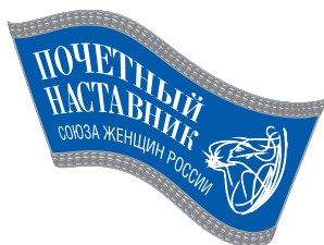
Почетный наставник Союза женщин России