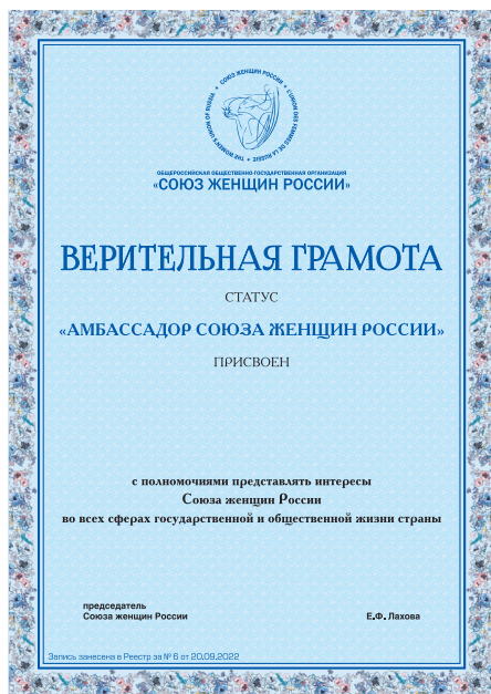
Верительная грамота «Амбассадор Союза женщин России»