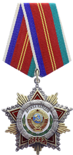
Орден Дружбы Народов

Союз женщин России как правопреемник Комитета советских женщин гордится наградами, которыми в свое время был награжден Комитет.