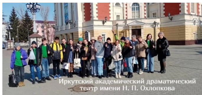
Участники творческого коллектива «Созвездие талантов» Лермонтовской СОШ выразили искреннее восхищение посещением драматического театра имени Н.П. Охлопкова

Также в апреле 2023 года в областном Образовательном центре "Персей" для ребят-участников проекта будет организована при поддержке министерства образования Иркутской области профильная творческая смена, в рамках которой пройдет областная фестиваль школьных театров "Алые паруса" (150 чел.). Победители его примут участие в торжественном финале проекта — форуме "Школа мысли, действия, чувств" в мае 2023 года.