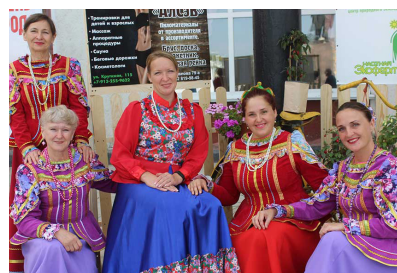
Занятие по культуре в рамках фестиваля «Степные россыпи»