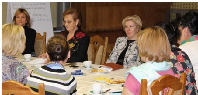
Встреча в Курском региональном отделении Союза женщин России с наставницами в женском предпринимательстве проводятся регулярно

Дальше события стали принимать незапланированный характер. К нам стали обращаться мужчины-предприниматели, известные своей активной жизненной позицией с предложением стать наставниками. Таким образом, в настоящее время мы работаем совместно. За это время семь наставников оказали поддержку 11 молодым предпринимателям.