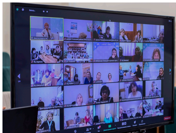
Занятие по семье с участием всех муниципалитетов Фестиваль Школа

Четвертое занятие по теме «Отцовская застава» прошло в формате встречи отцов трех поколений. Это были команды: «отцы-патриархи», у которых уже растут внуки и правнуки, «отцы-молодцы» — главы многодетных семей, и «будущие отцы» — студенты вузов, колледжей и юноши старших классов. Встреча, на которой состоялась дискуссия о роли отца в семье и отцовства в обществе, проходила в рамках новой акции именно с таким же названием «Отцовская застава». Эта акция была рождена нашей организацией вместе с краевым Советом отцов в честь Дня отца в России, учрежденного Указом Президента.