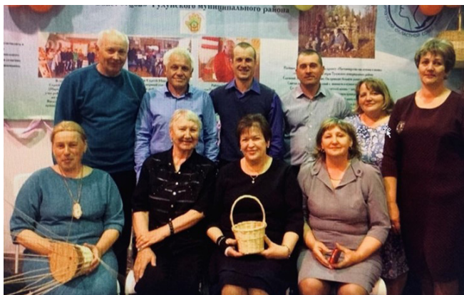
Совет отцов Тулунского района представляет проект на Областной выставке «Мир семьи. Страна детства»

Проект формирует стойкое неприятие к негативным явлениям, пропагандирует здоровый образ жизни, решает задачи улучшения качества семейного воспитания. В рамках проекта организовано широкое движение наставничества Советов отцов и Советов женщин по месту жительства над детьми и подростками, воспитывающимися в неполных семьях и нуждающимися в поддержке.