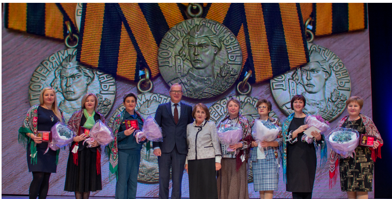
Активисты женского движения Алтая, в большинстве своем председатели муниципальных советов женщин, награжденные на этом Форуме наградами Союза женщин России

Состоялось торжественное награждение всех активистов в работе с семьей и детьми по воспитанию главных качеств у подрастающего поколения медалями Союза женщин России. Среди награжденных также были и председатели Советов женщин.