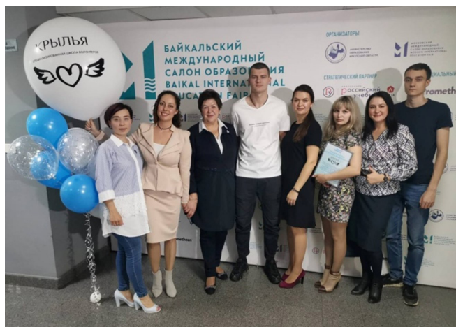
Школа волонтеров «Крылья» — участник Байкальского международного салона образования

Механизм «общественной поддержки» — коллективного наставничества над такими семьями успешно запущен, уже отработана технология наставнической работы с такими семьями и сейчас фонд вместе с советами женщин продолжает и развивает эту деятельность.