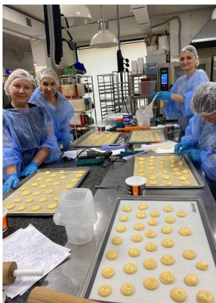
Обучение мам профессии «домашний кондитер»

Только в рамках данного проекта 41 мама особенного ребенка воспользовалась возможностью получить новые профессиональные навыки по направлениям: домашний кондитер, основы швейного дела, парикмахерское искусство, лэш-мейкер и др. Некоторые из мам уже организовали свое надомное дело, пополняя свой скромный семейный бюджет. В течение всего проекта (полтора года) с семьями работали на безвозмездной основе врачи, юристы, психологи и другие специалисты, сопровождая родительские сообщества и помогая мамам в решении их актуальных проблем.