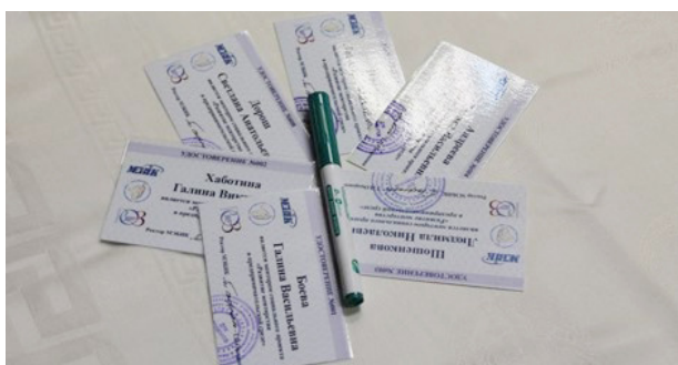
Каждая наставница получает от Курского регионального отделения Союза женщин России персональное удостоверение