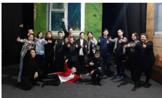
Новонуктуская СОШ Нуктуского района. Школьный театр «Занавес». Успех – окрыляет!

В рамках второго направления "Театр — как точка роста. Театральная педагогика в школе" проведены мероприятия с участниками театральных коллективов (150 чел.) и их педагогами (10 чел.): мастер-классы и обучающие семинары для педагогов, встречи-консультации по работе над спектаклем, речевые тренинги и тренинги по сценическому искусству с детьми и др. Результаты работы по данному направлению будут представлены на генеральных прогонах — сдаче спектаклей школьных театров перед родителями и широкой общественностью в апреле 2023 года (1000 участников).