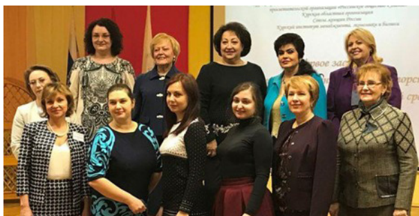
Встреча первых наставниц и учениц