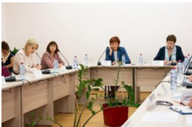
Педсовет «Школьный театр как вариативный модуль рабочей программы воспитания»

А при Информационно-методическом центре развития образования г. Иркутска создана команда наставников, сопровождающая психолого-педагогическое направление деятельности педагогических коллективов по разработке и внедрению в единый образовательный процесс школы вариативного модуля Программы воспитания «Школьный театр» и внедрению элементов театральной педагогики в работу школьных педагогов.