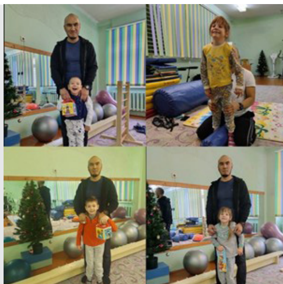
г. Усть-Илимск. Помощь рядом.

Работа с сообществами «Близкие люди» (близкие и по проблемам, и по задачам, которые лучше решать сообща) организована под патронажем фонда и с участием приглашенных специалистов в 10 МО Иркутской области: гг. Ангарск, Иркутск, Саянск, Усть-Илимск, Усолье-Сибирское; районы Балаганский, Иркутский, Слюдянский, Нукутский, Шелеховский.