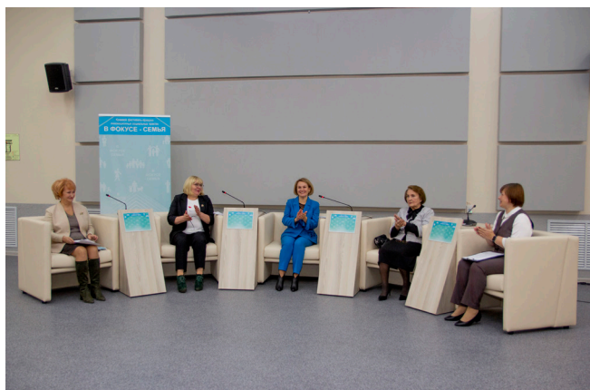
Участники открытия пленарной части занятия, посвященного семье, в рамках краевого форума «Семья – в фокусе» (в режиме онлайн)

Третье занятие, посвященное семье, прошло в рамках краевого форума «Семья — в фокусе», где аудиторией (в режиме онлайн) стали: социальные работники, педагоги, активисты Советов женщин в районах и городах, а также участники самого фестиваля в краевом центре. Здесь в концертном зале «Сибирь» на двух этажах были развернуты выставки-презентации о работе с семьями в нашем крае. Сотни специалистов социальной сферы, общественников, волонтеров приняли участие в мастер-классах, круглых столах и других активных формах работы фестиваля. Ключевым исполнителем этого занятия было Министерство социальной защиты, а в его пленарной части выступали представители краевых органов власти, руководители отраслей социальной сферы, ученые и общественники.