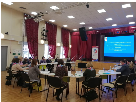
Занятие по патриотическому воспитанию школьников

Седьмое занятие было непосредственно посвящено наиглавнейшей теме — воспитание патриотов и созидателей. Первая часть прошла в форме заседания краевого координационного Совета по патриотическому воспитанию на площадке Управления по молодежной политике Алтайского края, также (в режиме онлайн) с трансляцией на места, в муниципальные образования.