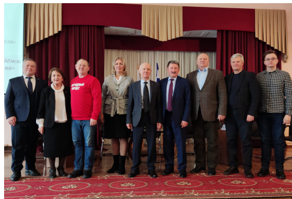
Занятие в рамках молодежного Форума на тему «Формирование патриотизма у молодежи» на базе Алтайского краевого архитектурно-строительного колледжа, на сцене педагоги, наставники, представители органов власти и общественности

Восьмое занятие по теме «Культура как духовное богатство общества» для различных категорий молодых людей, как и многие занятия, прошло при совместном участии органов власти и общественности, особенно Советов женщин на местах и всего краевого отделения СЖР при поддержке Союза женщин России.