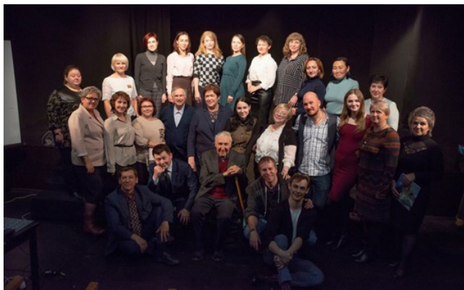
Творческий коллектив Опорного центра по поддержке школьных театров при ИТУ

А при Информационно-методическом центре развития образования г. Иркутска создана команда наставников, сопровождающая психолого-педагогическое направление деятельности педагогических коллективов по разработке и внедрению в единый образовательный процесс школы вариативного модуля Программы воспитания «Школьный театр» и внедрению элементов театральной педагогики в работу школьных педагогов.