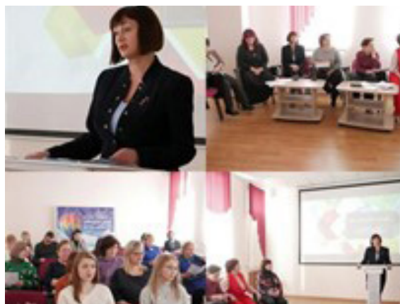
Семинар для педагогов «Воспитание театром»

В целом, успешная реализация проекта «Театр — школа жизни» не только решит его главную цель (создание эффективной модели сопровождения школ по поддержке школьных театров и воспитанию гармонично развитой и социально ответственной личности средствами театрального искусства в рамках межведомственного взаимодействия и системы социального партнерства государственных и общественных организаций), но и внесет также свой вклад в развитие коллективных форм наставничества в разрабатываемую сегодня в Иркутской области по нашей инициативе модель наставничества в общественных организациях.