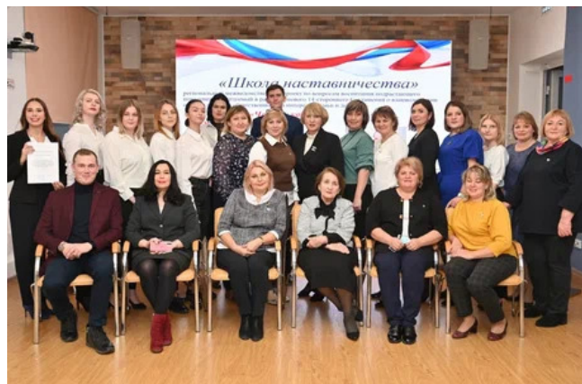
Участники двух команд «Педагогического баттла», проведенного в рамках второго занятия Школы наставничества