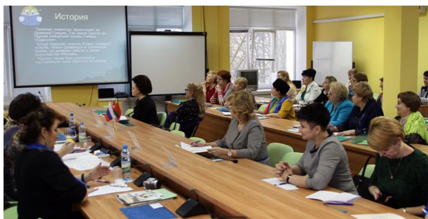
Заседание Курского регионального совета наставников в женской предпринимательской среде