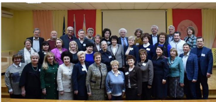
Члены Курского клуба «НАСТАВНИК»

Чтобы стать командой, члены клуба не просто знакомятся ближе друг с другом, а делают это в процесс бизнес-игры «ЭКОДВИЖ», познавая «премудрости» экологического просвещения, формируя новые экопривычки.