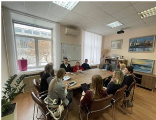
Первая встреча опытных наставников со своими подопечными в г. Иркутске

От Иркутского регионального отделения Союза женщин России в него уже включились 5 наставников и 5 начинающих предпринимателей, проведена организационная встреча, начата разработка Программы поддержки социального предпринимательства через институт наставничества.