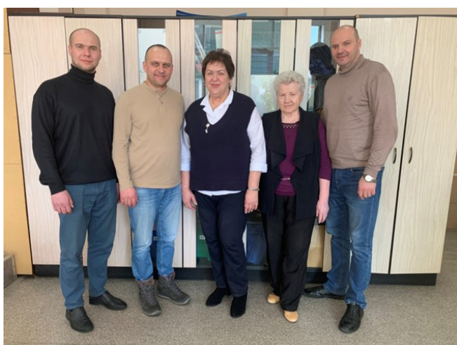
Давние и надежные партнеры Областного совета женщин — Союз отцов г. Иркутска

Проект получил дальнейшее развитие в 2019 году в рамках грантового проекта Губернского собрания общественности Иркутской области «Отцы-наставники» (10 МО Иркутской области).