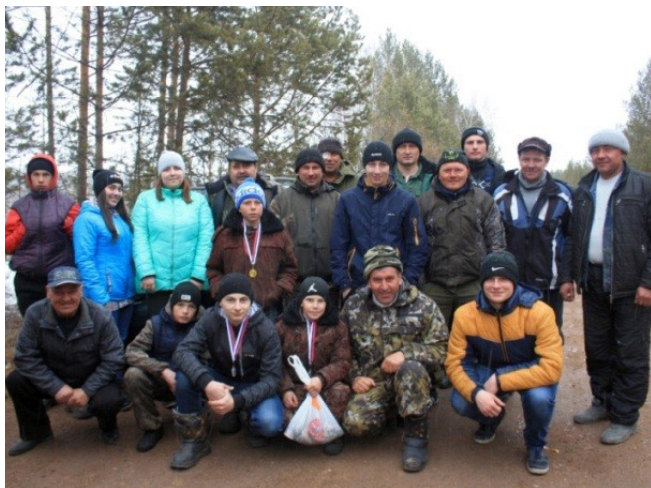
Отцы-наставники Усольского района с подопечными на подлёдном лове

Совместный общественный труд, спортивные занятия и соревнования, турпоходы и краеведение, обучение необходимым жизненным навыкам и домашнему ремеслу, помощь ветеранам, отряды МЧС и многое другое, что организовали наставники для своих подшефных — все это можно назвать настоящей Школой жизни и добра.