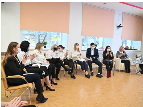
Команда студентов старшего курсу педуниверситета, принимавшая участие в «Педагогическом баттле»

Вторая часть занятия по проблемам воспитания прошла в форме « Педагогического баттла ». Соревновались две команды: студенты старших курсов педагогического университета с названием «Перспектива – 22» и опытные педагоги-воспитатели из школ края с именем «Мэтры». Объективно судила группа экспертов — авторитетных ученых. Бой шел на равных, побежденных не оказалось, зато в ходе этого профессионального сражения родилось много дельных предложений по вопросам воспитания подрастающего поколения.