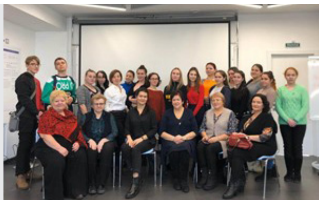
Команда проекта «Близкие люди»

С 2018 года Благотворительный фонд «Семья Прибайкалья» (учредителем фонда является Иркутский областной совет женщин) занимается развитием системы детского паллиатива в Иркутской области — около 200 семей из 10 муниципальных образований (более 500 чел.), воспитывающих детей с неизлечимыми заболеваниями, получают общественную поддержку фонда.