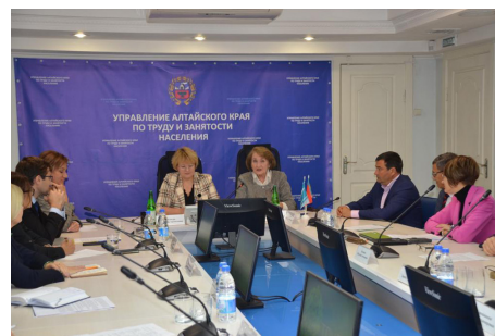
Идет занятие, за столом представители 14-стороннего Соглашения органов власти и общественности, спикеры занятия

Само занятие проходило в формате краевой конференции на площадке названного краевого управления с участием представителей почти всех 14-стороннего Соглашения, а также работодателей, обществу, рабочей и студенческой молодежи.