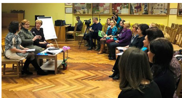
Наставницы и ученицы получили консультации по взаимодействию