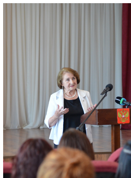
Открытие занятия по указанной теме

Слушателями были сотни девушек-студенток колледжей, их педагоги, а преподавателями — ученые