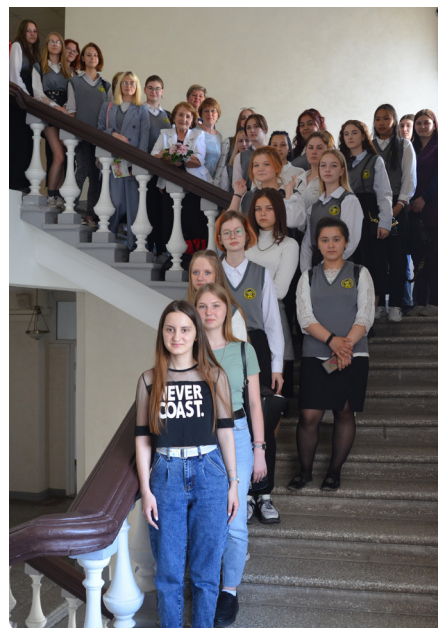
Слушатели занятия – студентки колледжей края