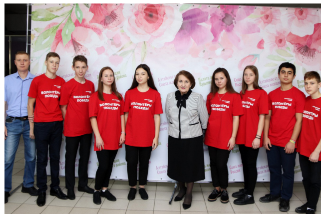
Один из отрядов участников занятия

Вторая часть прошла как молодежный Форум на тему «Формирование патриотизма у молодежи» на базе Алтайского краевого архитектурно-строительного колледжа с участием студентов из других колледжей, а также с членами всех патриотических молодежных формирований Алтая. Не исключением и для этого Форума стало участие в нем представителей 14-стороннего Соглашения, в первую очередь Министерства образования и науки Алтайского края, Института развития образования, членов Общественного совета данного колледжа, в основном, руководителей крупных строительных компаний в крае, потенциальных работодателей для студен-