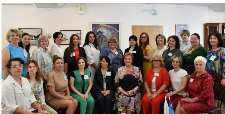
Члены Клуба предпринимательниц Курской области изъявили желание стать наставницами для курских студенток

К началу 2023 года в Клубе 45 творческих, активных, успешных предпринимательниц из городов Курск, Железногорск, Рыльск. Клуб принял решение: поддержать инициативу Министерства науки и высшего образования России о женском наставничестве в образовании и стать наставницами для студенток курских вузов. А, возможно, не только курских. Так и случилось: социальная миссия курских предпринимательниц обрела зримые черты в виде конкретной наставнической деятельности в разных молодежных аудиториях.