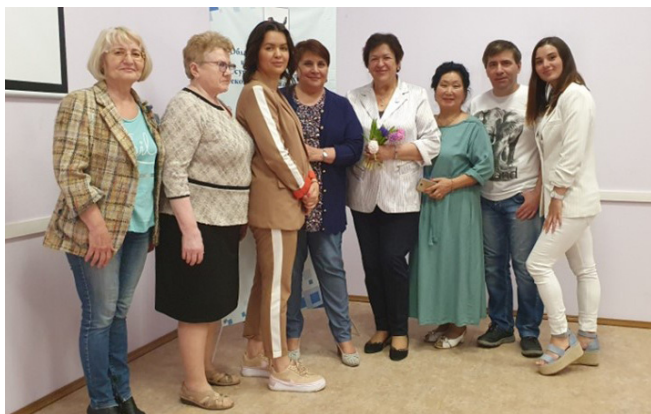
Команда наставников ИРО Союза женщин России

Основными критериями отбора наставников являются: мотивированность на волонтерскую деятельность, психическая устойчивость, опыт, авторитет, способность к коммуникациям. Люди, стремящиеся стать наставниками, могут иметь различные мотивы волонтерской (наставнической) деятельности — личные и общественные: