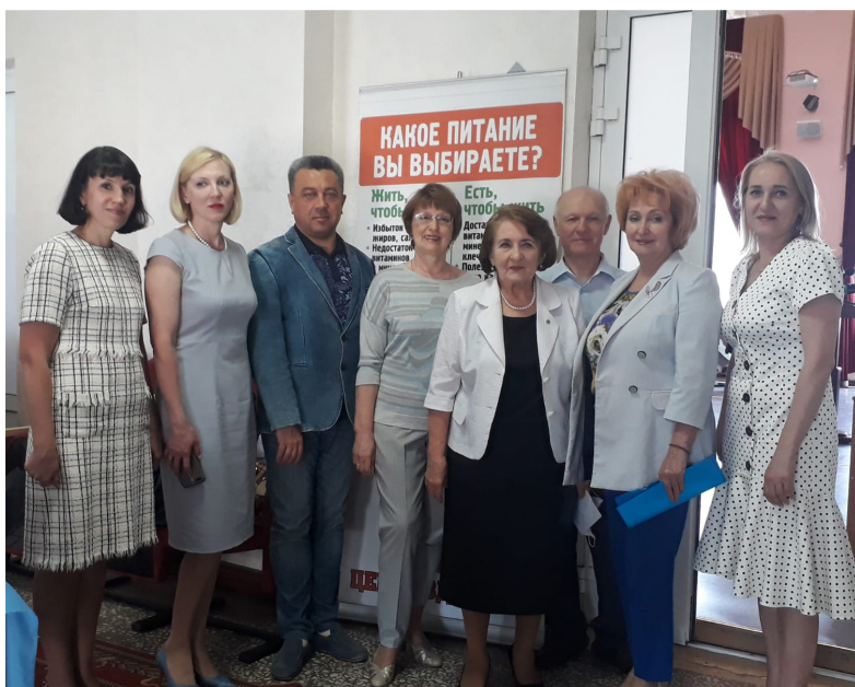
Преподаватели на указанном занятии, в основном, доктора мед.наук, профессора медуниверситета, представители Министерства здравоохранения края