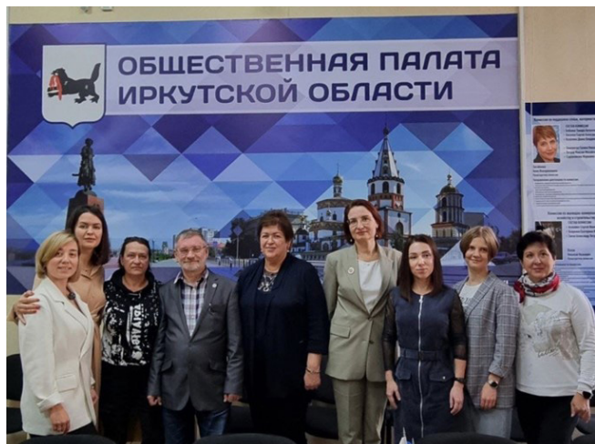
Круглый стол по проблемам семей, воспитывающих детей-инвалидов в Общественной палате Иркутской области

Работа проводилась по нескольким направлениям: информационное, правовое, психологическое сопровождение, организация культурно-образовательного досуга, консультирование специалистов, обучение новым профессиям. Все мероприятия проходили на региональном уровне (в режиме ВКС) и на муниципальном уровне в формате живого общения, конструктивного обсуждения, встреч со специалистами, социальных практик волонтеров, благотворительных акций и др.