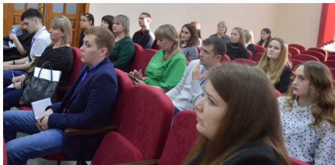
Тулунский район. Члены молодежного клуба «Наше время» — участники семинара по социальному проектированию

Проект расширяет коммуникации взрослых молодых людей, помогает им организовать свою жизнедеятельность с максимальной пользой для себя, для своей семьи и для общества. В проекте предусмотрен комплекс мероприятий, направленный на решение обозначенной задачи.