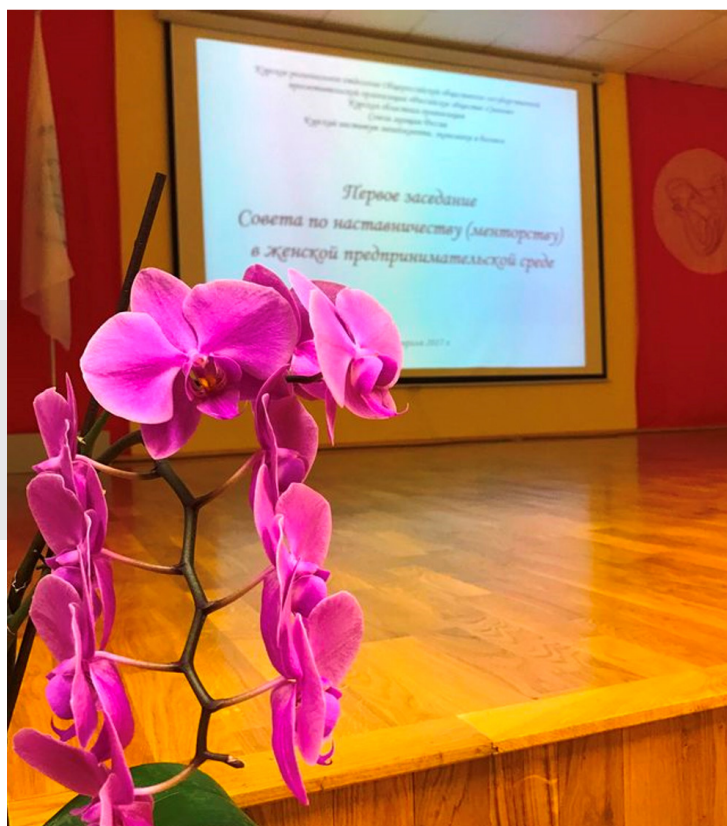
Совет наставников в женском предпринимательстве Курской области определил стратегию и тактику деятельности

Как говорится, «лиха беда начало». Уже к концу 2019 года в регионе проявили свой талант наставниц 22 участницы проекта, которым, по итогам срока наставничества, сказали слова благодарности 37 учениц.