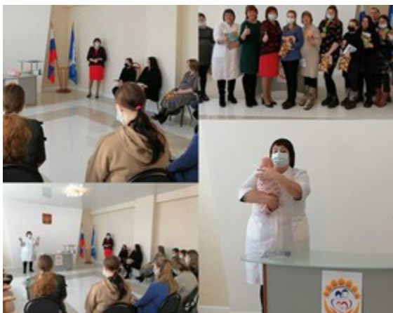
Куйтунский район. Заседание клуба «Наше время», посвященное семейным ценностям

Данная проблема обозначена в проекте как одна из актуальных, на ее решение направлены усилия молодежных палат, членов клубов, отделов ЗАГС, органов местного самоуправления. Участники проекта видят задачу в сохранении молодых семей, укреплении традиционных духовно-нравственных и семейных ценностей. Они ведут здоровый образ жизни, обмениваются опытом в воспитании детей, вместе организуют культурно-образовательный досуг, формируя осознанное и ответственное родительство.