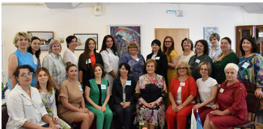
Заседание Курского регионального совета наставников в женской предпринимательской среде в рамках проекта «Школа наставничества». Курское РО.