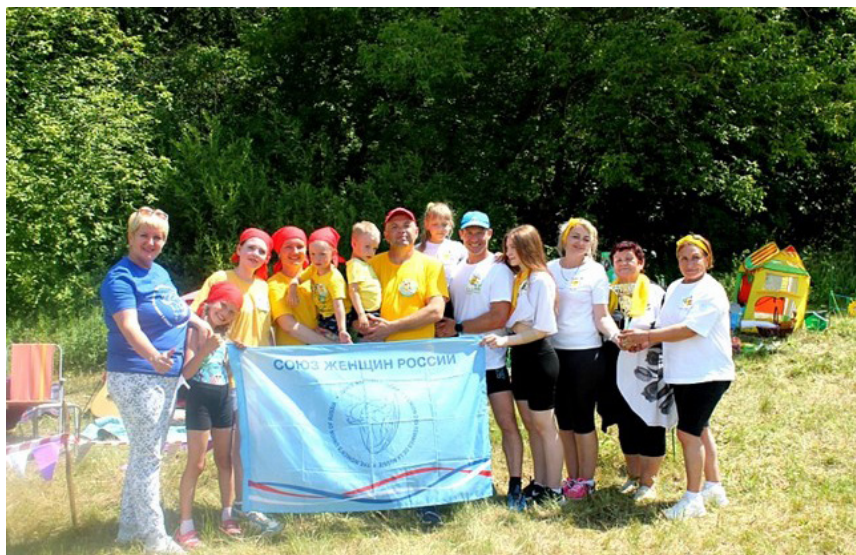
Турслет семей «Отдыхаем по-семейному» — пропаганда здорового образа жизни, приобщение детей к совместным формам досуга и отдыха с родителями. Сергиевский женсовет Самарского РО.