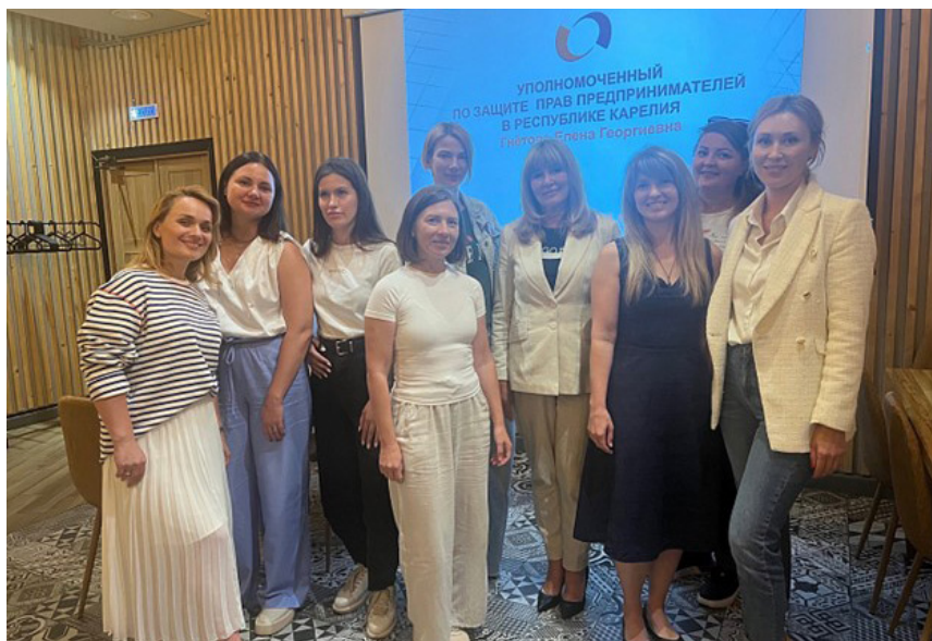
Встреча участников Клуба женщин-предпринимателей Карельского отделения СЖР.