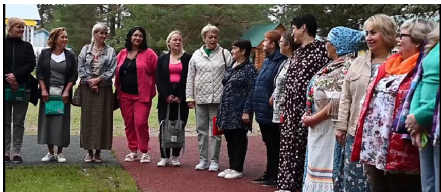
Участницы слёта женщин «Лаборатория успеха — 2023». Мастер-класс по инициативному бюджетированию. Архангельское РО.