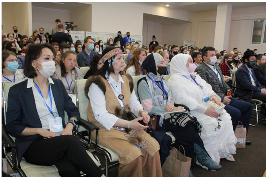
Активистки регионального отделения СЖР Еврейской автономной области — участницы и инициаторы Первого молодёжного этноконфессионального форума «Территория согласия» (укрепление единства между народами и конфессиями России).