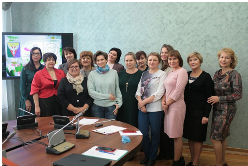
Образовательный социальный проект «Академия добровольчества: цифровизация и проектирование». Союз женщин Челябинской области.