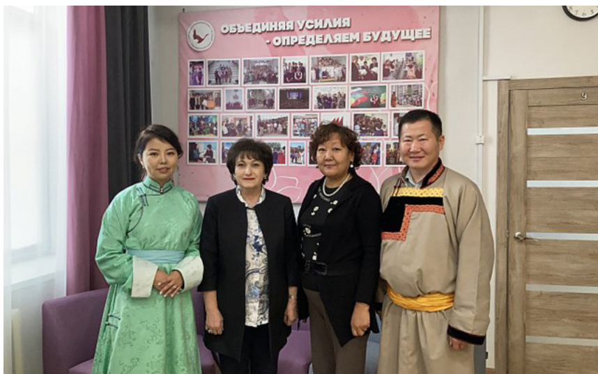
Проект «Народная дипломатия». Сотрудничество Союза женщин Забайкальского края с женщинами Монголии: гуманитарные связи, взаимодействие женщин, занятых в бизнесе. Совместные проекты молодежного крыла Забайкальского РО и молодежи Монголии.