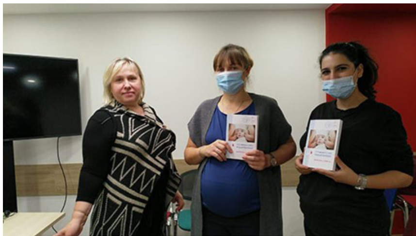
Проект «Социальная адаптация молодой семьи и молодых родителей в общество». Школа «Готовимся стать родителями. Вопросы и ответы» — подготовка молодых пар к рождению ребёнка. Московский городской совет женщин в партнерстве с «Центром помощи социально-незащищенным семьям и детям «Большая медведица».