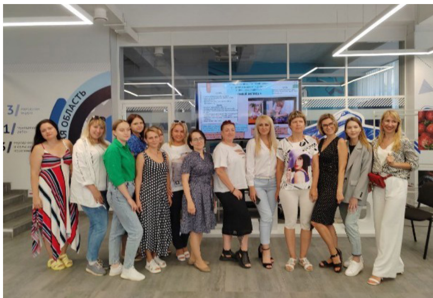
Участницы социальных творческих проектов. Ульяновское РО.