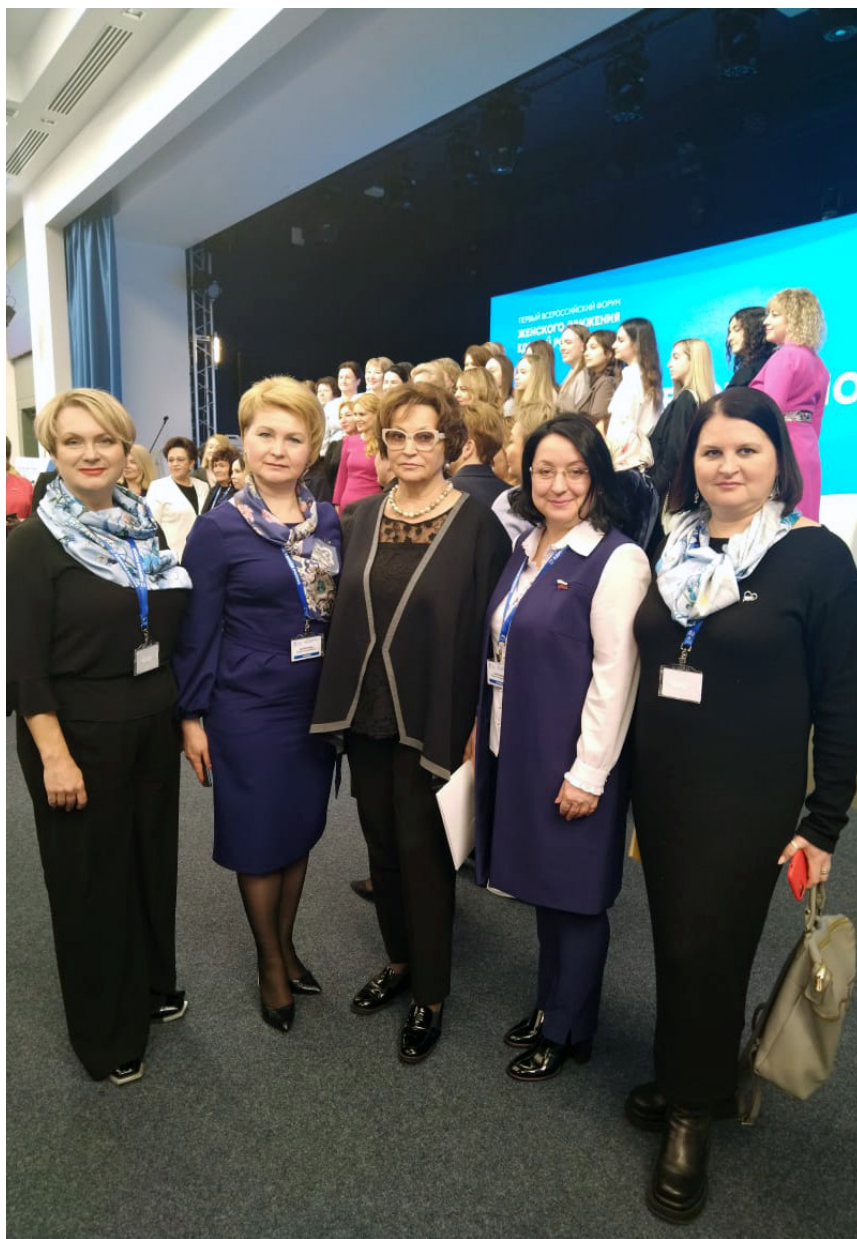
Участие председателей РО СЖР во Всероссийском форуме «Женское движение Единой России». Расширение участия женщин в работе политических партий.