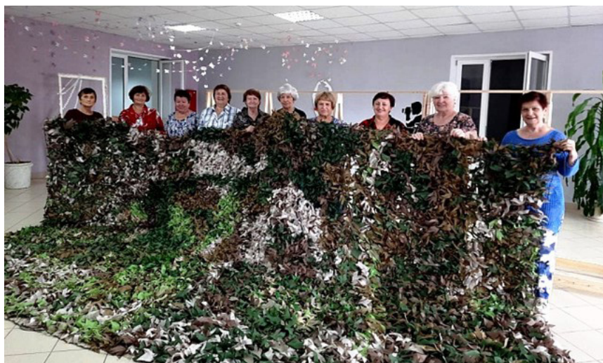
Помощь бойцам Специальной военной операции. Заокский районный женсовет Тульского РО.