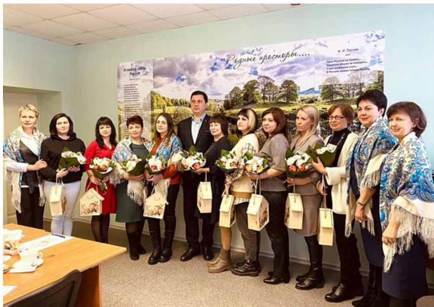
Комитет семей воинов Отечества. Корочанский район, Белгородское РО.