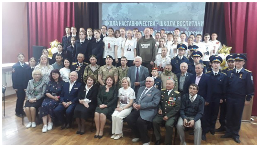
Проект «Школа наставничества — школа воспитания», перекличка поколений патриотов. Сохранение преемственности поколений. Алтайское краевое РО.