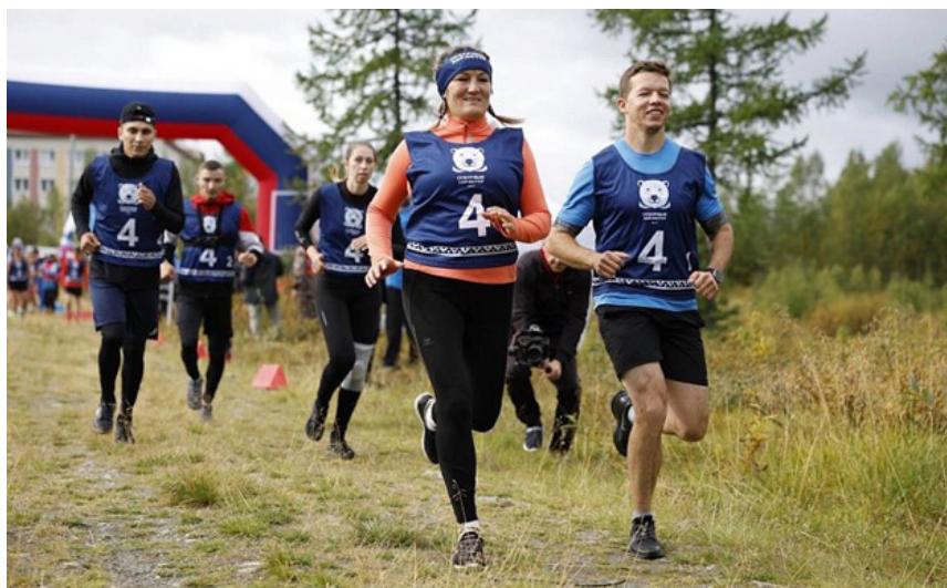
Новоуренгойский женсовет — участие в экстремальном забеге «Северный характер». Ямало-Ненецкое РО.