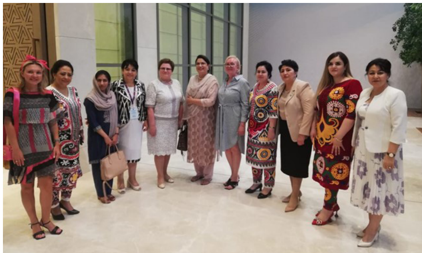
Участие делегации Союза женщин России в Форуме женщин Шанхайской организации сотрудничества. (г. Ташкент)