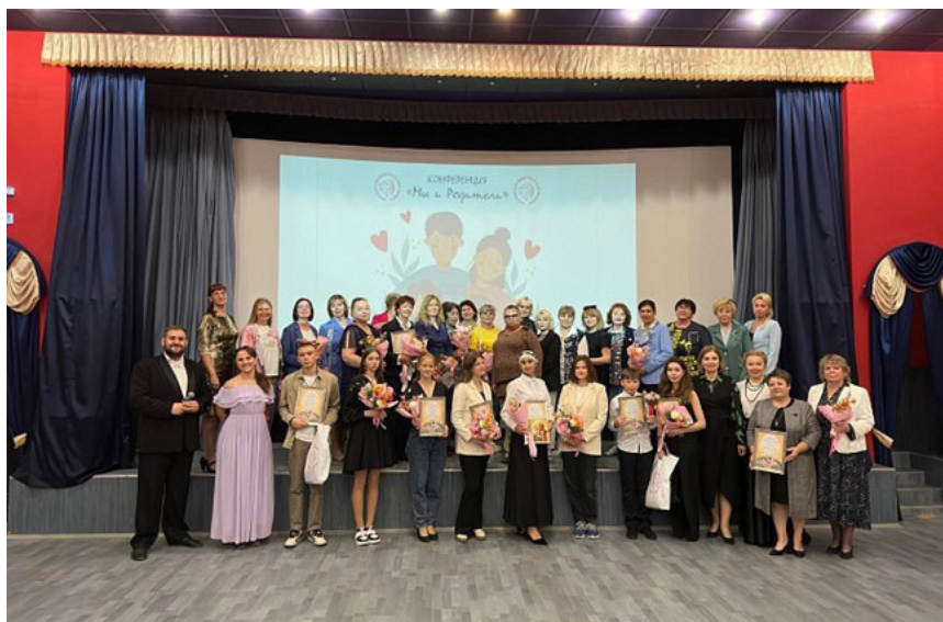
Региональная практическая конференция «Мы и родители» — опыт педагогов и наставников в формировании образ женщины и матери с раннего возраста. Ярославское РО.