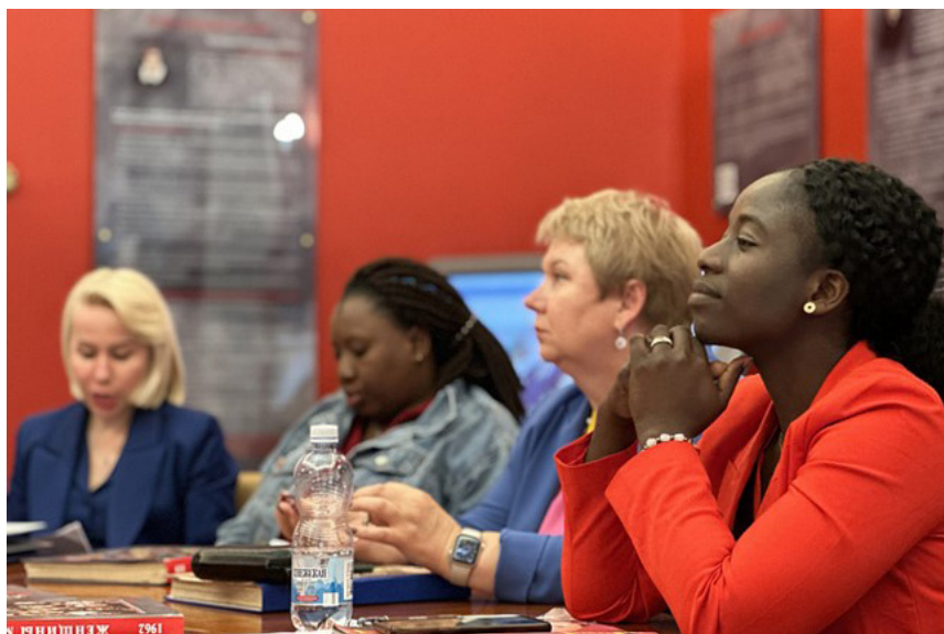
Участницы первого Российско-Африканского женского форума на площадке Союза женщин России.