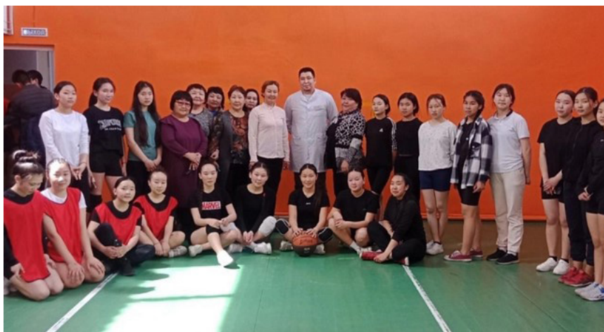
Проект «Женщины Тувы за здоровую нацию». РО СЖР Республики Тыва.