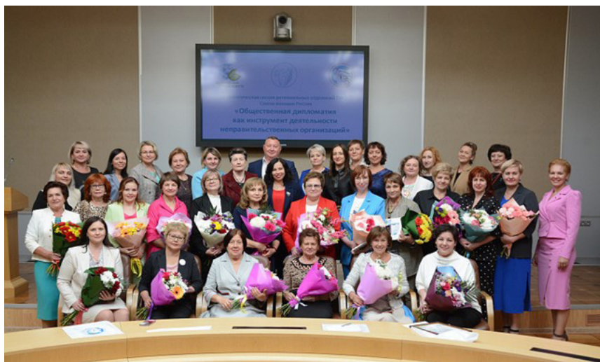
Участники стратегической сессии Приволжского ФО «Общественная дипломатия как инструмент деятельности неправительственных организаций». Оренбургское РО.