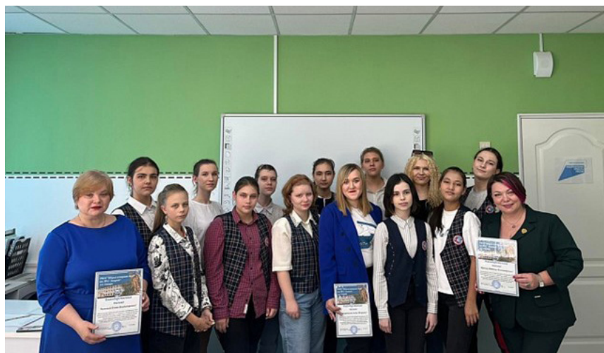
Клуб женщин-предпринимательниц Самарской области. Поддержка подопечных региональных социально-образовательных учреждений. Самарское РО.